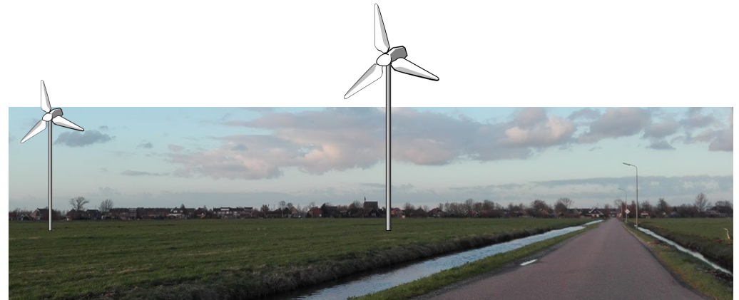
Deze afbeelding met windmolens is niet representatief, maar geeft wel een idee hoe het er uit zou kunnen zien.